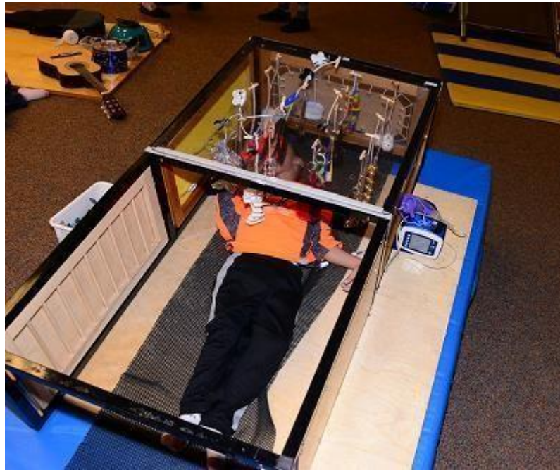
Figura 1. Se muestra a un niño con parálisis cerebral explorando los objetos dentro del Little room. Active learning space. (s.f). By Dr. Lilli